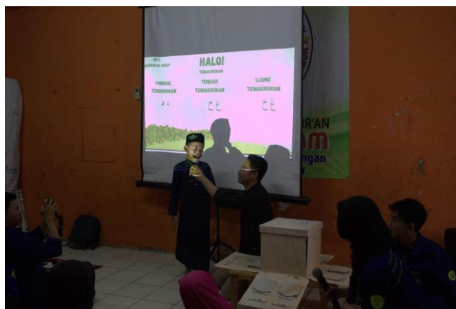
Gambar 3. Implementasi media

Setelah media dinyatakan layak, dilakukan implementasi media Tajwid Exploration Box dalam kegiatan pembelajaran di TPA Nurul Islam. Implementasi diawali dengan sosialisasi penggunaan media kepada pengajar dan santri, dilanjutkan dengan penggunaan media secara langsung dalam kegiatan pembelajaran. Kegiatan pembelajaran dilaksanakan dalam dua kali pertemuan, di mana santri terlibat dalam aktivitas pembelajaran menggunakan komponen media yang telah disiapkan.