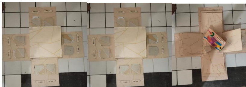
Gambar 1. Lapisan Tajwid Exploration Box

Pemanfaatan Media Tajwid Exploration box di TPA Nurul Islam pada kegiatan ini tidak hanya dipandang sebagai syiar Al Qur'an, melainkan sebagai sebuah aksi pemberdayaan masyarakat ( community empowerment ). Secara fundamental, pemberdayaan merupakan sebuah paradigma yang menempatkan komunitas sebagai subjek dan pelaku utama perubahan dengan tujuan akhir membangun kemandirian masyarakat (Helman & Zubaidah, 2024). Dalam konteks keagamaan, kegiatan pengabdian ini sejalan dengan konsep dakwah bil hal , yang bertujuan untuk mengubah keadaan ( mad'u ) ke arah yang lebih baik melalui tindakan, termasuk pendidikan (Antoni et al., 2024). Tindakan nyata berupa penyediaan media dan pelatihan metode pengajaran modern menunjukkan suri tauladan dan komitmen terhadap kualitas umat.