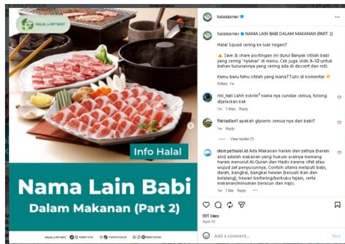
Gambar 2. Nama Lain Babi dalam Makanan

mendukung keterbacaan pesan, sehingga informasi dapat diakses dengan mudah oleh khalayak. Infografis ini menjadi pintu masuk utama dalam strategi dakwah visual karena mampu menyederhanakan pengetahuan syariah yang kompleks menjadi informasi praktis yang relevan dengan kebutuhan masyarakat.