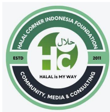
Gambar 4. Logo @halalcorner

sebagai pengingat spiritual yang sederhana namun kuat, karena setiap kali khalayak melihat logo atau warna khas tersebut, mereka langsung mengaitkannya dengan nilai halal dan kewajiban syariah. 30 Hal ini menunjukkan bahwa simbol visual memiliki peran penting dalam proses internalisasi nilai halal. Lebih jauh, konsistensi penggunaan simbol ini juga memperkuat branding dakwah digital sehingga pesan yang disampaikan memiliki daya ingat tinggi dan mudah dikenali oleh khalayak luas. Untuk lebih jelasnya dapat dilihat pada gambar di bawah ini: